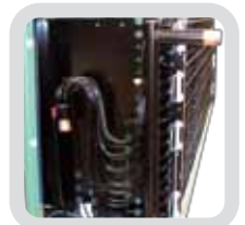
Protección epóxica en serpentín