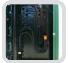
Facilidad de conexión