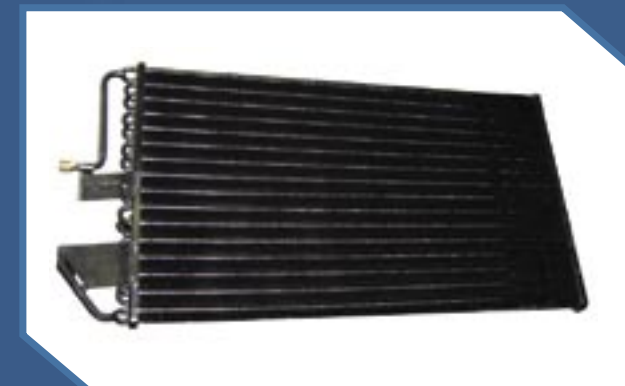
Serpentines de reemplazo