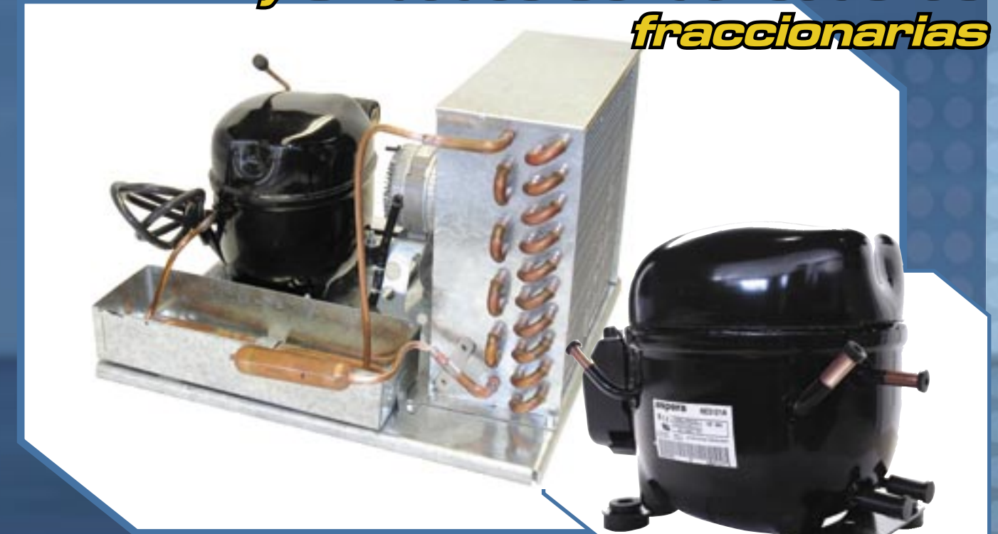
De 1/4, 1/3 y 1/2 HP

Compresores Fraccionarios, y Unidades Condensadoras fraccionarias