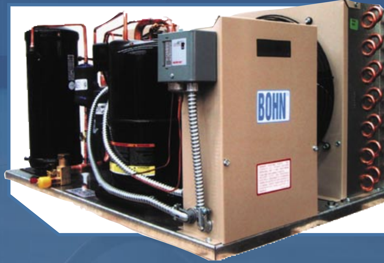
Herméticas Modelos JH y SJH (1/2 a 5HP)