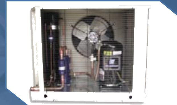
Modelos Scroll BZT/BZN (2 a 6HP)