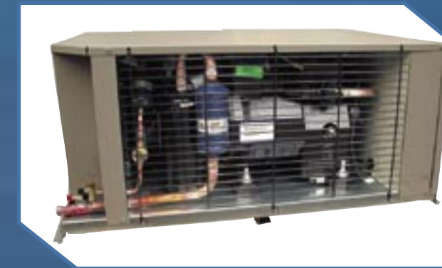
Modelos BS (1/2 a 5 HP)