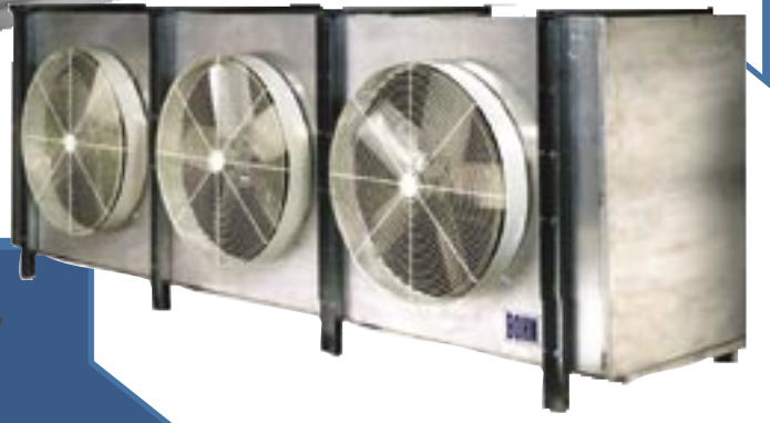
Modelo BHA, BHE/BHL, BHG/BHF