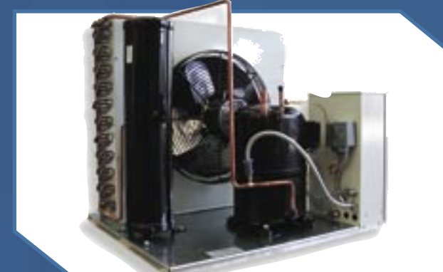
Modelos CH (1 a 5 HP)