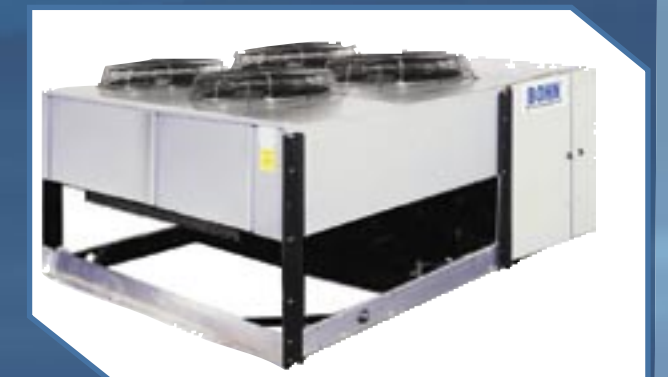
Modelos JLD/JBD (24 a 80 HP)

Compresores Fraccionarios, y Unidades Condensadoras fraccionarias