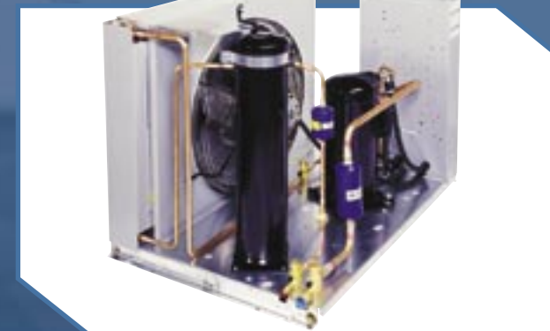
Modelos BH (1/2 a 5 HP)