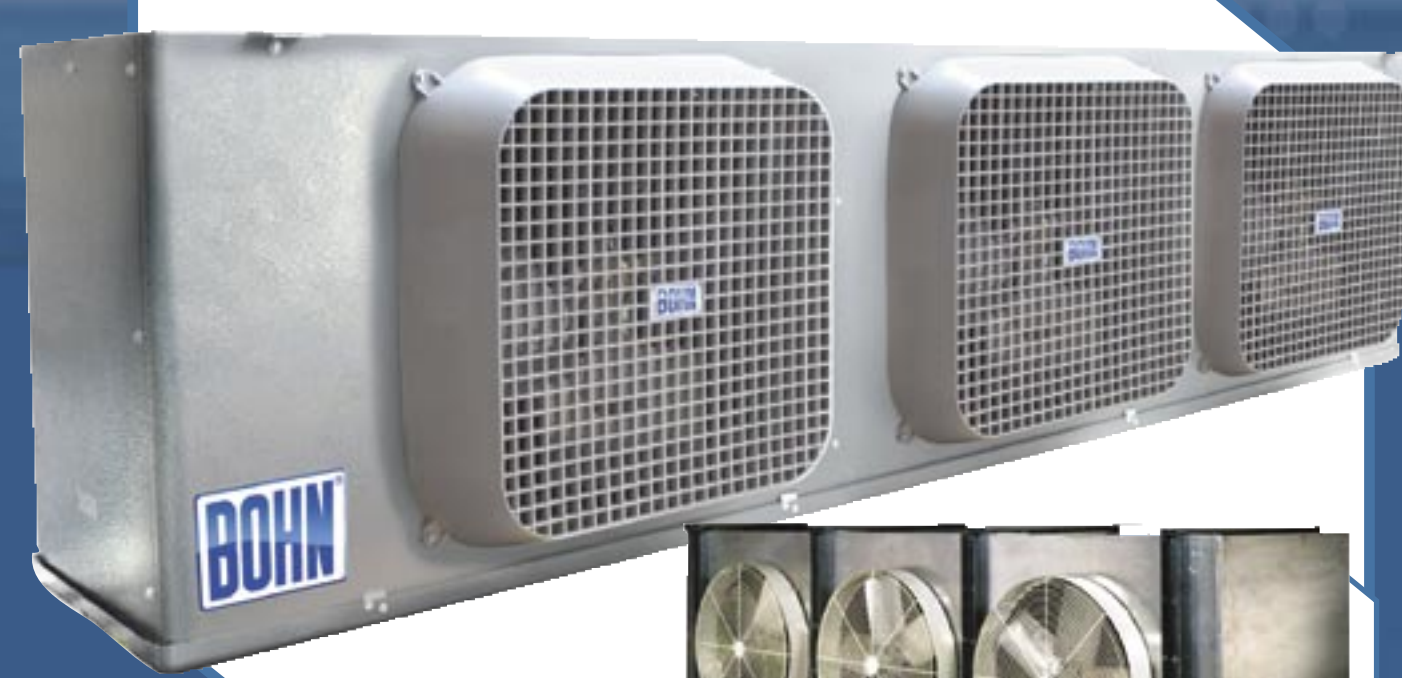
Modelo BMA, BME/BML, BMG/BMF

Para cámaras frigoríficas Deshielo por aire, eléctrico y gas caliente