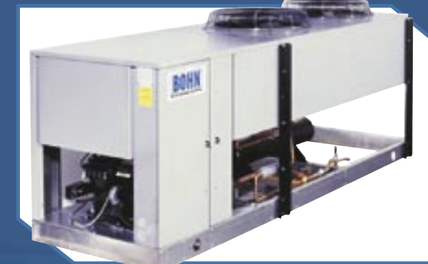
Modelos BDT/BDN (3 a 22 HP)