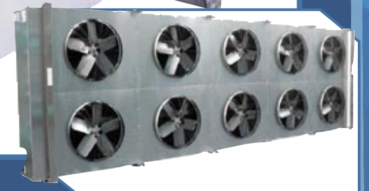
Modelos BR (21 a 212 toneladas)