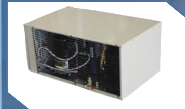
Modelos MBHX (1 a 5 HP)