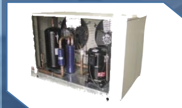
Modelos MBQX (7 1/2 a 12 HP)