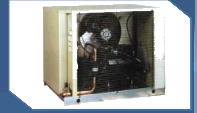
Modelos BLV/BBV (12 a 40 HP)