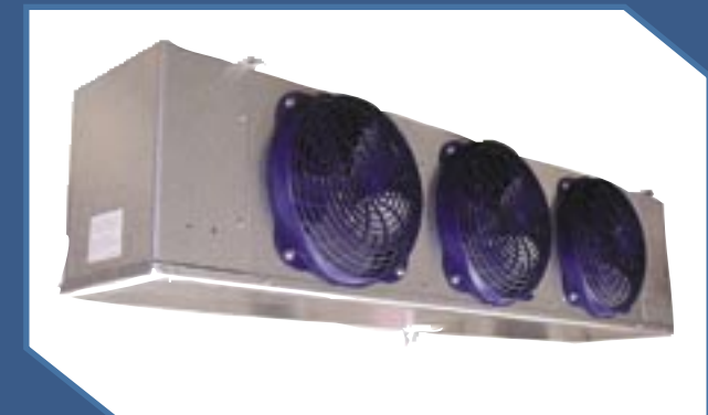
Modelo ADT, LET Y LLE, HGT