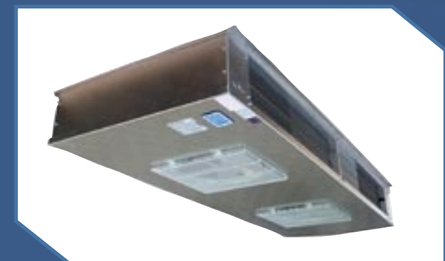
WK, WKE, WKG