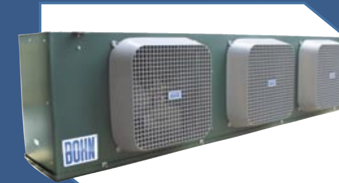
Modelos BMA/BME, ADT Cámaras de maduración