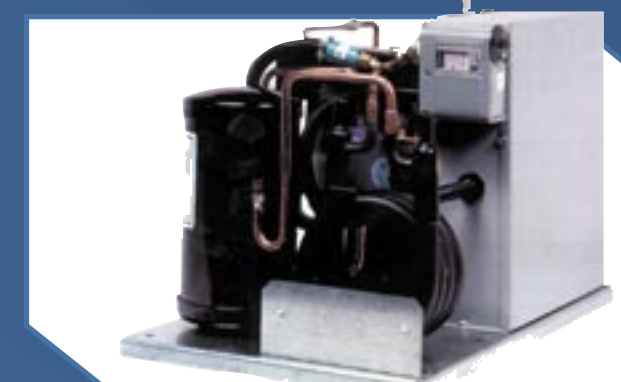
Modelos SWN (3/4 a 22 HP)

Unidades motocompresoras enfriadas por agua