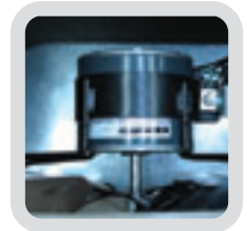
Motores alta eficiencia